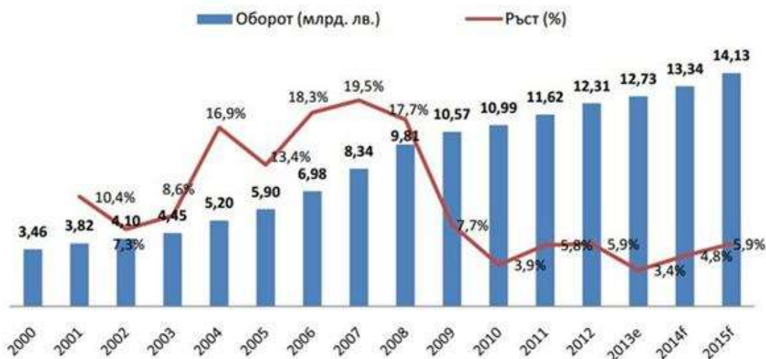
Търговията на дребно с храни, напитки и тютюневи изделия (млрд. лв.), 2000-2015

Според частта в проучването, посветена на фискалните ефекти от развитието на търговските вериги „Данъчните ефекти от присъствието на големите вериги не се изчерпват само с изсветляване на търговията и повече внесени косвени данъци. От 2007 г. досега десетте най-големи търговци с храни на дребно са внесли близо 475 млн. лв. данъци и осигуровки върху възнаграденията на служителите си. Към тези числа трябва да се прибавят и приблизително 78 млн. лв. платени корпоративни данъци по оценки на ИПИ на база данни от веригите. Кумулативният ефект върху фиска от внесените преки и косвени данъци и от изсветляването на част от търговията с храни за периода 2007-2013 г. се изчислява приблизително на 1,93 млрд. лв. или 1,3% от данъчно-осигурителните приходи в консолидираната фискална програма за същия период.“