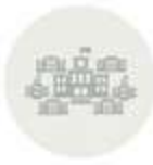
ОБЩА ЧИСЛЕНОСТ НА АДМИНИСТРАЦИЯТА