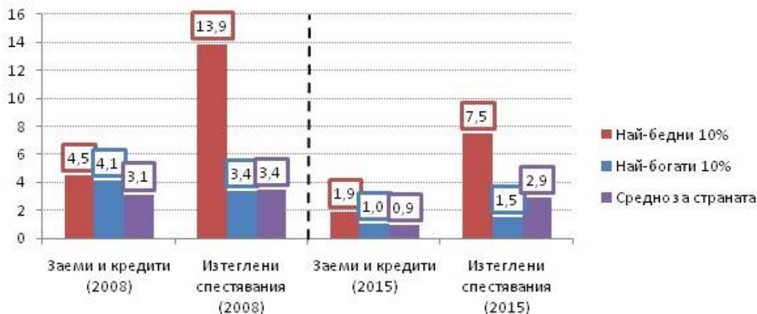
Доходи от заеми, кредити и изтеглени спестявания (2008/2015), %

Добрата новина тук е, че през целия период се наблюдава ясна тенденция на спад – доходите от изтеглени спестявания при най-бедните 10% спадат от 13,9% през 2008 г. до 7,5% през 2015 г., а при заемите и кредитите спадът е от 4,5% на 1,9%. Т.е. втората производна е положителна и темпът на намаляване на нетните финансови активи на най-нискодоходните 10% от домакинствата се забавя. Наред с други разгледани индикатори (като намаляващият относителен дял на разходите за храна), това говори за известно подобряване на цялостното финансово състояние и структурата на разходите на домакинствата. Разликите обаче остават значителни, като особено притеснителен е ниският дял на разходите, насочени към „свободно време, култура и образование” - с особен фокус, разбира се, върху образованието.