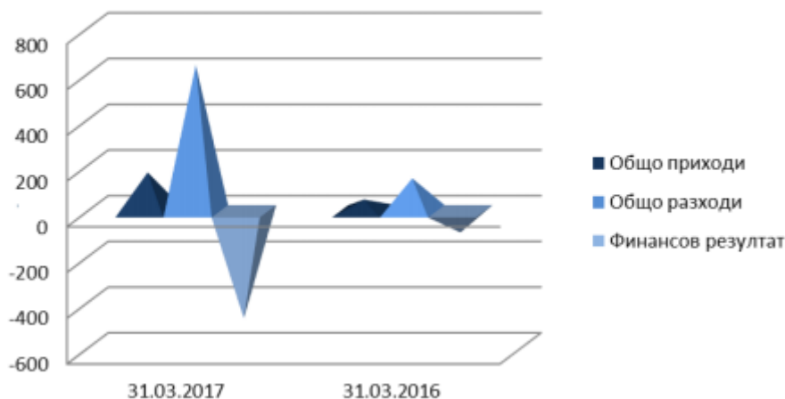
Приходи, разходи и финансов резултат

В отчета на ДКК пише, че на 12 януари 2017 година ръководството на ДКК са преизбрали членовете на съвета на директорите на „Кинтекс“ ЕАД, гр. София с нов тригодишен мандат. Съветът на директорите на ДКК е направил промяна в състава на ръководството на казанлъшката фирма „НИТИ“ ЕАД, като е освободил един негов член, а на негово място е назначил друг.