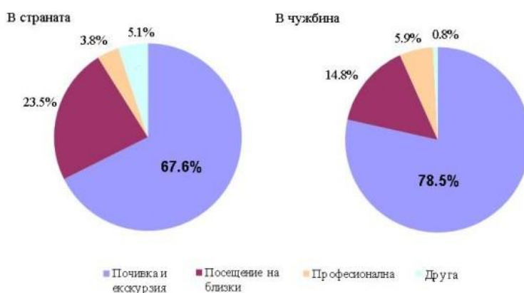
Структура на туристическите пътувания по цели в страната и чужбина през третото тримесечие на 2017 година

В сравнение със същото тримесечие на предишната 2016 година общият брой на пътувалите българи нараства с 31.2%. Пътувалите само в страната са се увеличили с 32.8%, пътувалите само в чужбина бележат ръст с 43.3%. Броят на тези, пътували у нас и в чужбина, обаче намалява с 21.6%.