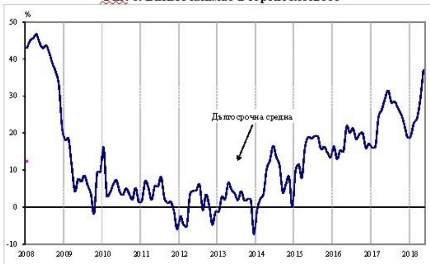
Фиг. 6. Бизнес климат в строителството