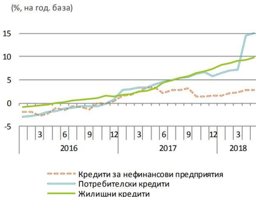
Граф. 13: Кредит към частния сектор

Банковите резерви продължават да предопределят общия спад. Парите в обращение имат най-голям положителен принос и нарастват с 10,9% спрямо година по-рано, следвани от задълженията към други депозанти, с ръст от 30,7%, посочват от финансовото министерство.