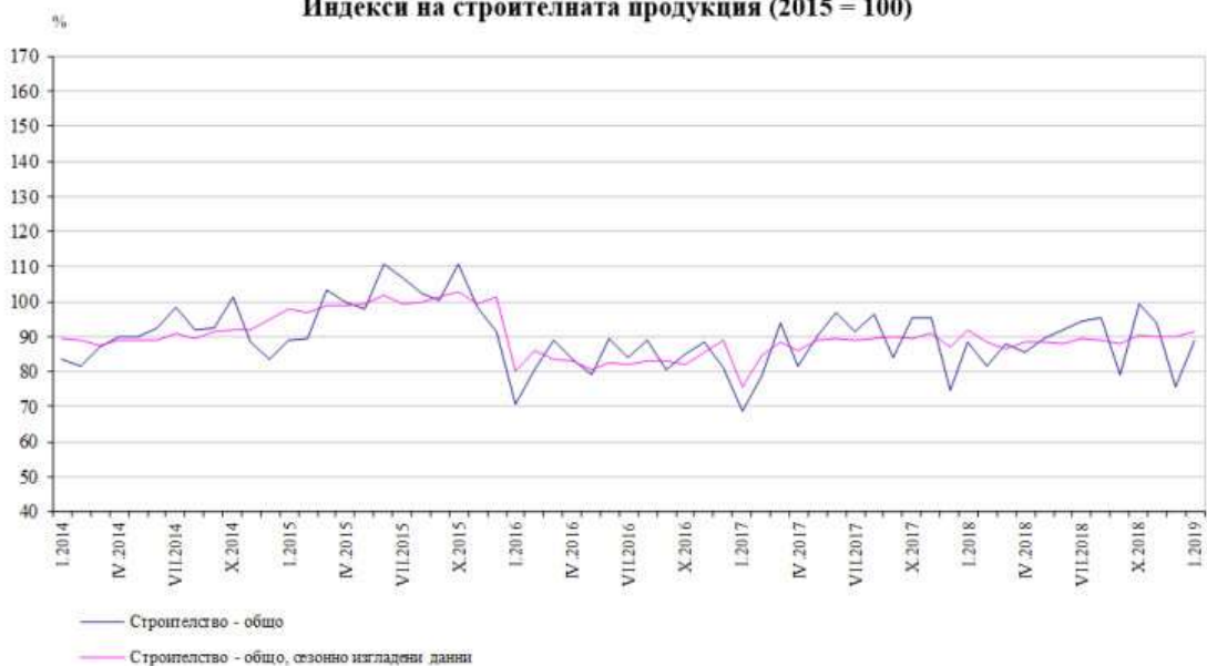
Индекси на строителната продукция (2015 = 100)

На месечна база през януари индексът на продукцията в сектор "Строителство" е с 1.5% над равнището от предходния месец декември.