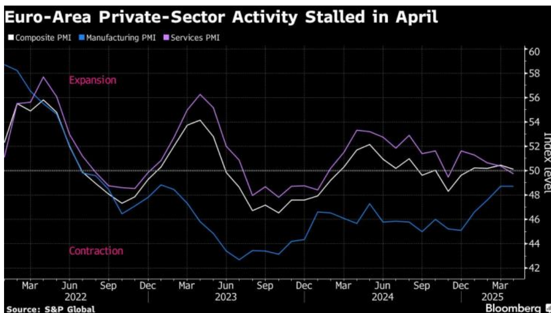
Ръстът на частния сектор в еврозоната спря през април

Влошаването до голяма степен се дължи на Германия, чийто собствен основен PMI измерител неочаквано спадна до под 50 за първи път от четири месеца. Франция също пропусна прогнозите на анализаторите, оставяйки под това ниво. И двете най-големи икономики в Европа отбелязаха изненадваща слабост в услугите.