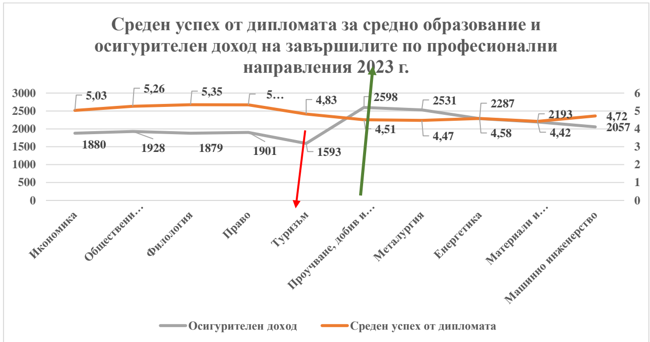
Фиг. 2 Среден успех от дипломата за средно образование и осигурителен доход по професионални направления за 2023 г. на завършилите.

образование. Но именно те са тези, които осигуряват специалисти с най-висока добавена стойност за българската икономика и социално-осигурителната ни система (Фиг. 2).