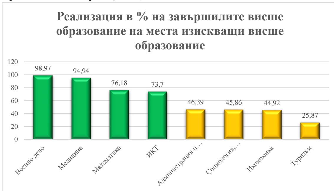
Фиг. 1. Относителни дялове на реализацията на завършилите висше образование на позиции, изискващи висше образование

За някои професионални направления на практика реализацията по специалността и на работно място, изискващо висше образование, е толкова ниска, че не оправдава по никакъв начин предлагания план - прием (Фиг. 1).