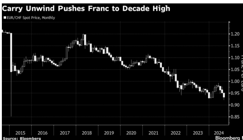
Развалянето на кери сделките изтласка франка до десетилетен връх

Макар че третото поредно понижение на лихвите от страна на Швейцарската народна банка (ШНБ) през септември изглежда свършен факт, това не намали апетита на дългосрочните инвеститори и спекулативните фондове. След като са купували франкове назаем и са ги продали, за да купят по-високодоходни валути, тези залози се развалят, тъй като привлекателността на франка като убежище нараства.