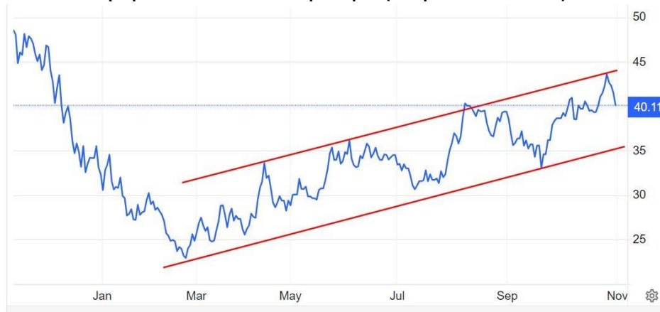
Графика на газовите TTF фючъри (в евро за мегаватчас)

В началото на ноември се очаква меко време в Северозападна Европа, въпреки че някои прогнози сочат понижаване на температурите към средата на месеца. Това може да увеличи потреблението на синьото гориво, тъй като търсенето на газ за енергия може да се увеличи.