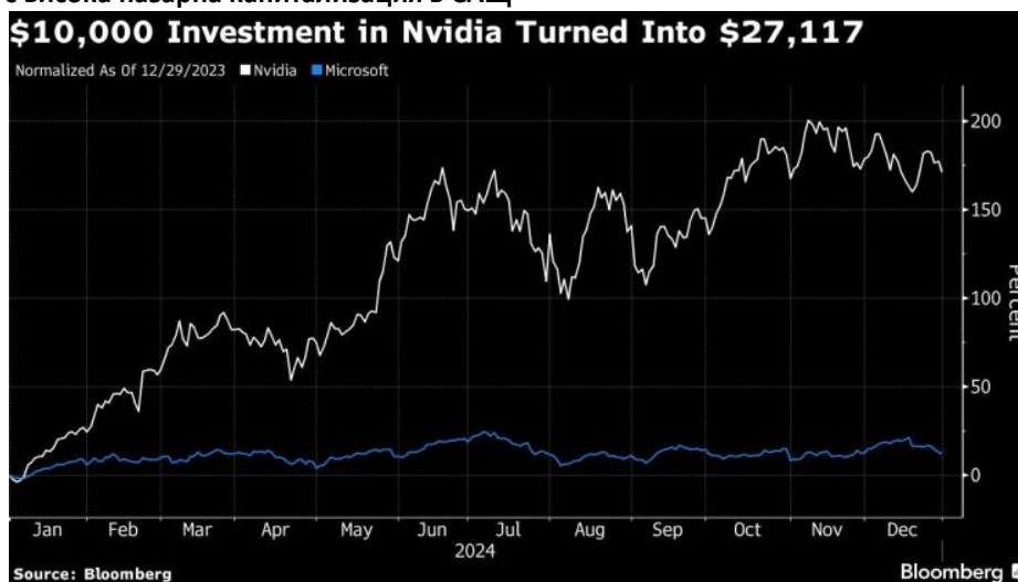
Инвестицията от 10 000 долара в Nvidia се превърна в 27 117 долара

Макар че ентузиазмът за трансформационния потенциал на изкуствения интелект издигна американския технологичен сектор като цяло, производителят на чипове Nvidia беше ясният победител сред основните имена, превръщайки 10 000 долара в 27 117 долара. За разлика от него Microsoft изостана, добавяйки 1209 долара към такава условна инвестиция.