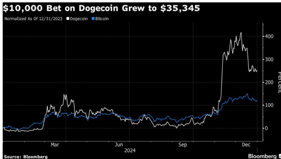
Залог от 10 000 долара на Dogecoin нарасна до 35 345 долара

Трейдърите се втурнаха към криптовалутите, очаквайки бум от обещанието на Тръмп да превърне САЩ в глобален стълб на сектора. Напредъкът от 253% на любимеца на множеството Dogecoin е можел да превърне залог от 10 000 долара в 35 345 долара. Подобен залог на пазарния лидер биткойн щеше да приключи с 22 046 долара. Покрай това биткойнът достигна рекордно висока стойност от 108 316 долара, преди да се отдръпне.