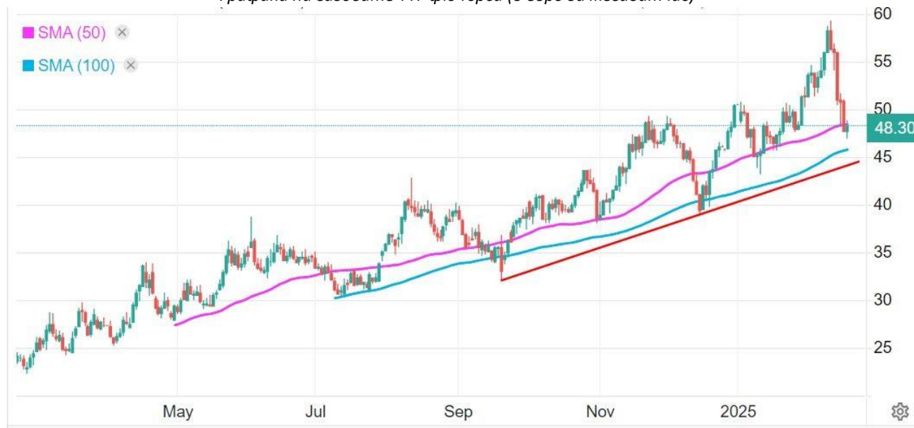
Графика на газовите TTF фючъри (в евро за мегаватчас)

Само в рамките на няколко дни газът в Европа поевтиня с близо 20% от двугодишния връх около 59,35 евро, достигнат на 11-ти февруари, тъй като намаляха опасенията относно бързото теглене на газ от хранилищата в ЕС.