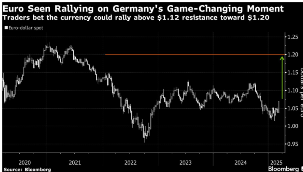
Еврото ще се повиши заради променящия се облик на Германия | Трейдърите залагат, че валутата може да се повиши над границата на устойчивост от 1,12 USD към 1,20 USD

Очакваното историческо увеличение на германските заеми, наред с нарастващите опасения за негативното въздействие на агресивните мита върху икономиката на САЩ, подкрепят еврото, предизвиквайки устрема на инвеститорите към експозиция на върха.