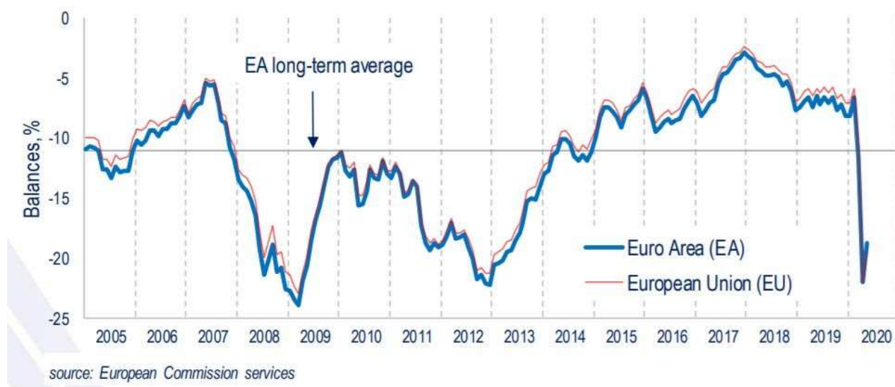
Индекси на потребителско доверие в ЕС и в еврозоната

Окончателните резултати от проучването на Европейската комисия ще бъдат оповестени на 28-и май, когато ще бъдат представени и данните за икономическите и бизнес нагласи на стария континент през четвъртия месец на годината.