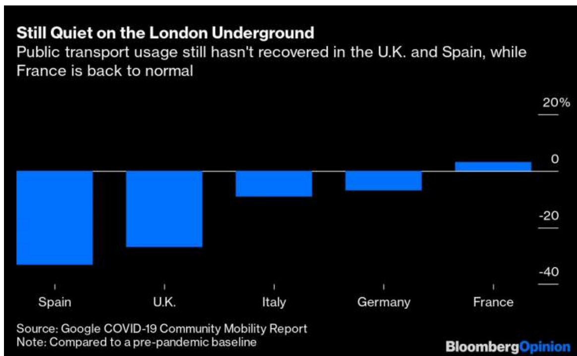
Използването на обществен транспорт не се е възстановило до предкризисните нива във Великобритания и Испания, но във Франция е. Графика: Bloomberg

Вероятно милениалите са сред служителите, които най-силно искат да се върнат на работните си места. Мнозина от тях живеят в малки апартаменти или делят къщи, близо до работните им места, така че желанието им да имат възможност да работят далеч от стаята, в която спят, и да се срещат с колеги на техните години е разбираемо. Освен това те вероятно по-лесно стигат пеша до работа или използвайки велосипед.