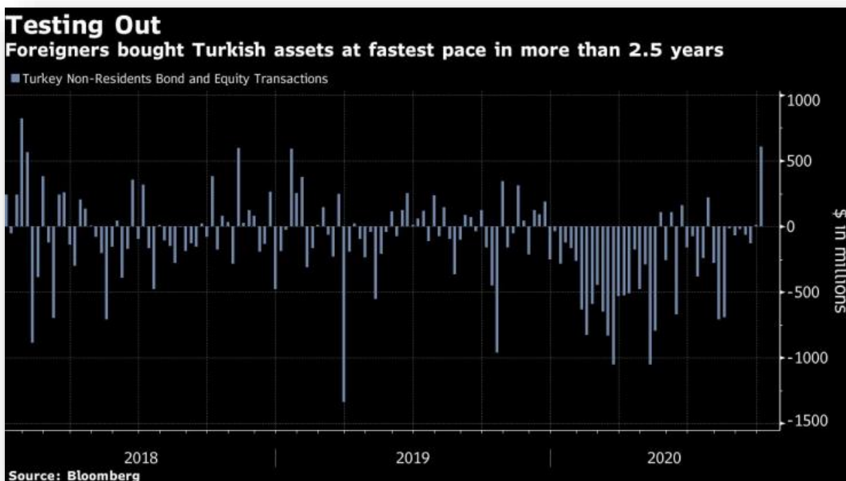
Чуждестранните инвеститори са купували турски активи с най-бърз темп от над две години насам след повишаването на лихвите.

Инвеститорите зад граница са купили турски облигации и акции за 610 милиона долара през седмицата, приключваща на 2 октомври, става ясно от последните данни на Турската централна банка. Това е най-големият поток на средства от януари 2018 г. насам, като се случва на фона на рекордното понижение на стойността на турската лира спрямо долара, въпреки че централната банка изненадващо повиши основните лихви.