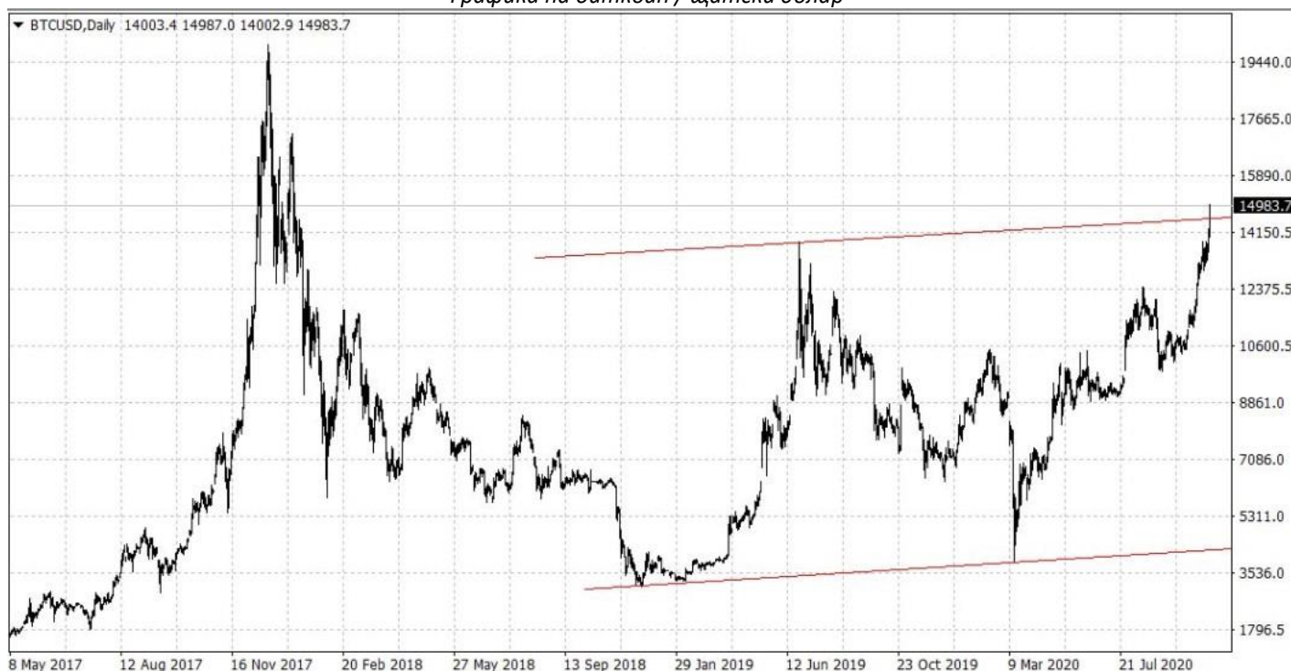
Графика на биткойн / щатски долар

Според данни на BTC.com трудността е спаднала до 16,787 трилиона, най-ниското ниво от юни насам. Тъй като цената на биткойна нараства значително през последните няколко месеца и количеството енергия, необходимо за добива на нови биткойни, намалява, се очаква увеличаване на маржовете на печалба за ефективни миньори.