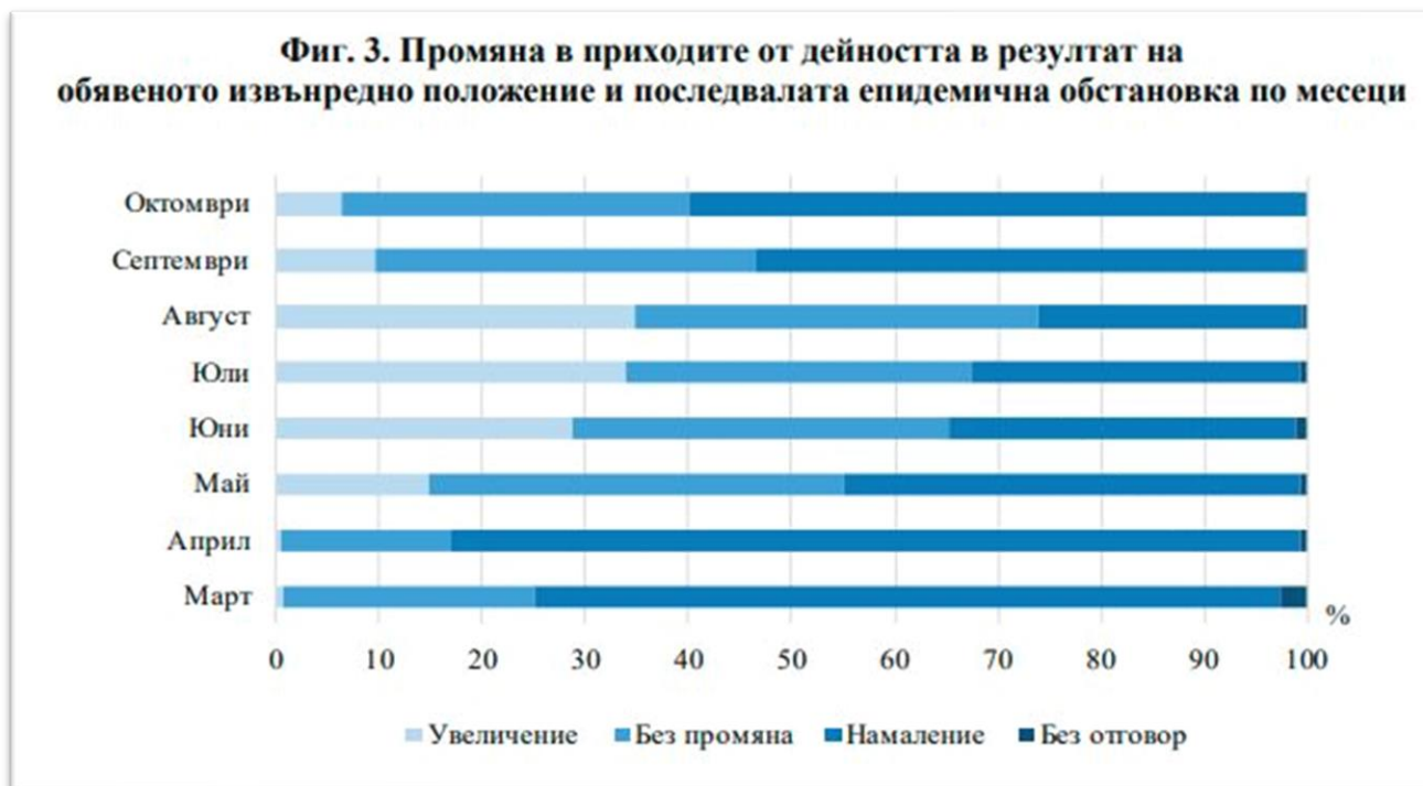
Фиг. 3. Промяна в приходите от дейността в резултат на обявеното извънредно положение и последвалата епидемична обстановка по месеци

За наетия персонал през последния месец анкетата регистрира увеличение на ръководителите, предприели основните мерки: "платен отпуск", "неплатен отпуск", "преминаване на непълно работно време", "намаляване на възнагражденията на персонала" и "дистанционна форма на работа". Същевременно местата за настаняване, които са се възползвали от правителствените мерки за подпомагане на работодателите за пореден месец, продължават да се увеличават и достигат 27.7 на сто.