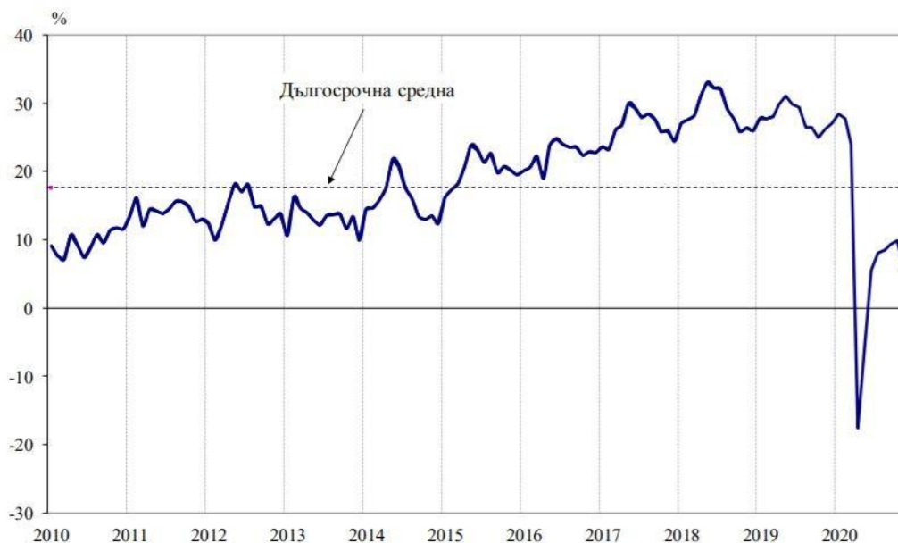
Общ индекс на бизнес климата

Общият показател на бизнес климата се понижава през ноември с 4,1 пункта след повишение с 0,5 пункта през октомври, като това представлява първо влошава на стопанската конюнктура от шест месеца насам, когато имаше устойчиво възстановяване след сривовете през март и април по време на първата вълна на коронавирусна пандемия, довела до локдаун в нашата страната.