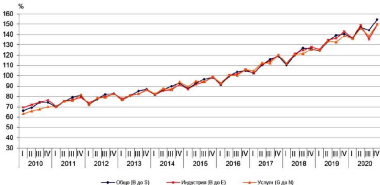
Индекс на общите разходи на работодателите за труд

Увеличението в индустрията е с 4,6%, в услугите - с 8,2%, и в строителството - с 6%.